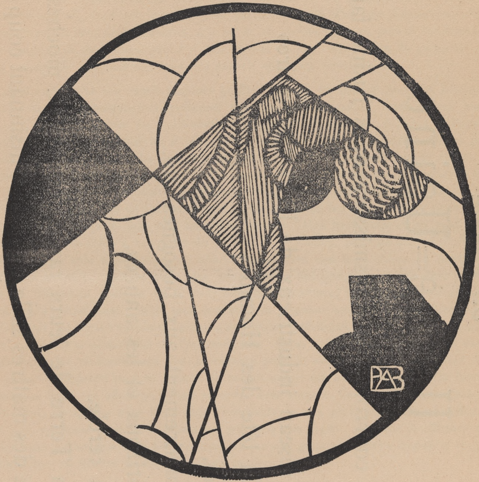
Femme nue dans une salle de bain